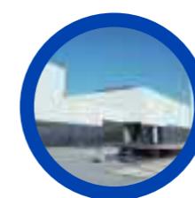
Museu Marítimo de Ílhavo (Aquário dos Bacalhaus)